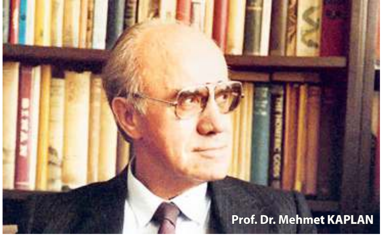
Prof. Dr. Mehmet KAPLAN

İstanbul Büyükşehir Belediyesi Kültür İşleri Daire Başkanlığı- Kültür Müdürlüğü tarafından düzenlenen “Edebiyatımızın İçinden” programı bu sezon da devam ediyor. Yeni sezonda ilk olarak Mehmet Kaplan hatırlanıyor.